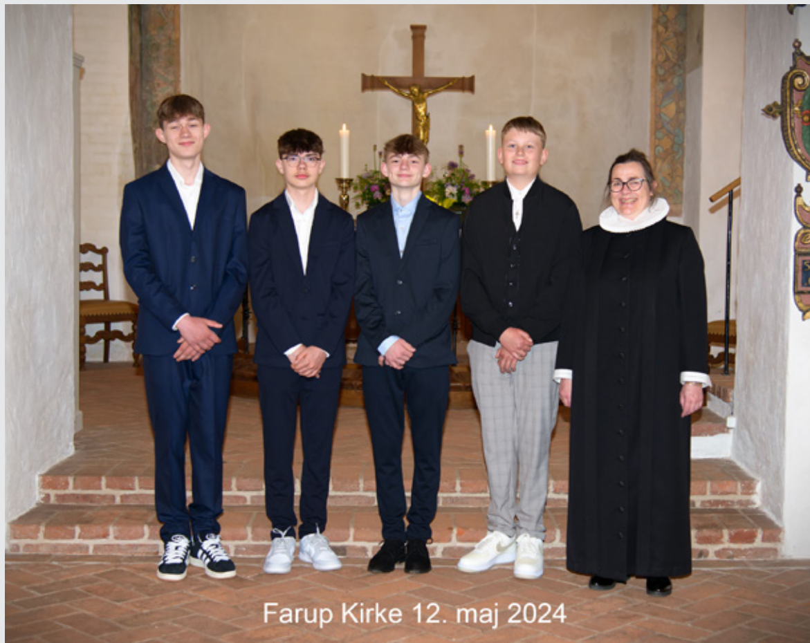
Farup Kirke 12. maj 2024

I Marsk & Muld vil vi stadig gerne give et overblik over de handlinger, som har fundet sted i Farup Kirke, og det findes her i den faste rubrik ”Kirkebogen”.